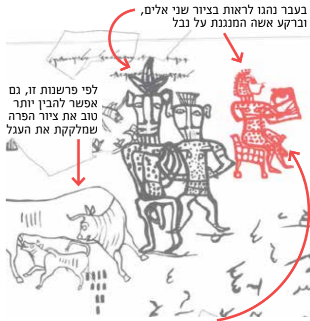
בעבר נהגו לראות בצירוף שני אלים, וברקע אשה המונחת על נבל. הצירוף מראה מראה, הדומה ל"נבל" שהאשה מונחת על גביה. וילד יוצא בין רגליה