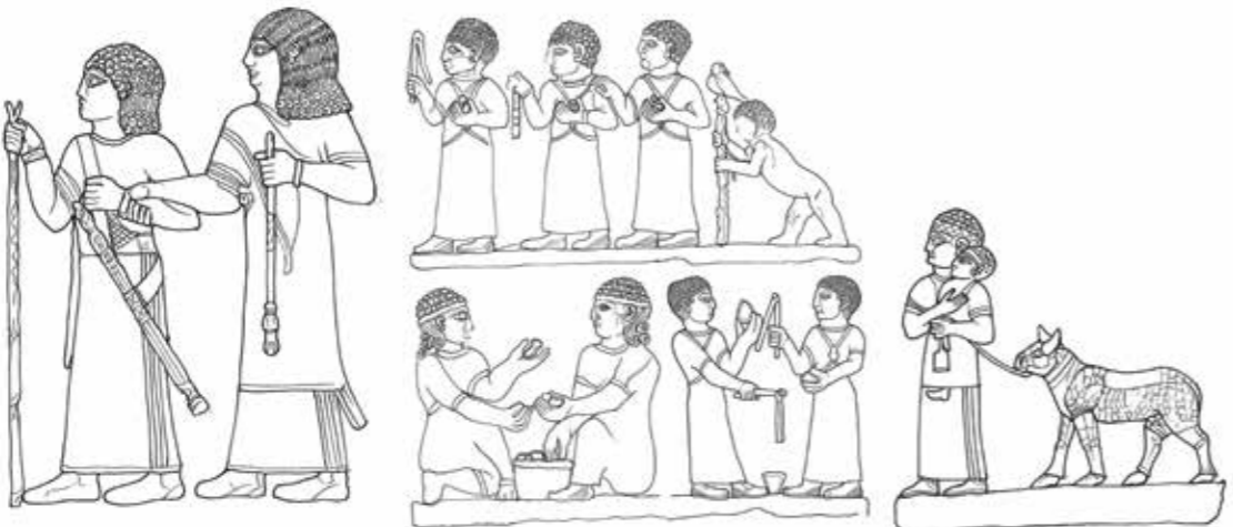
מימין: צלמית אשה הרה מתקופת המאה השישית-שביעית לפני הספירה. משמאל למעלה: מבוגרים אוזחים בידי ילדים בשיירת השבויים, פרט מתוך תבליט הקרב בתיל טובה בשנת 650 לפני הספירה. למטה: תבליט אבן מהמאה השמינית לפני הספירה.

לא רצוי, מימין לא רצוי (בנות) או כבעל מום. בחפירות מבנה בתל אשקלון, למשל, התגלו בכיבוש עצמות של עשרות שלדי טינוקות, רובם זכרים ודוקא. את ההסבר לכך אולי אפשר למצוא בשימוש של הבניין שמ' על הבניין – בית בושת. ככלל, ארכיאולוגים ממעטים למצוא שלדים של ילדים. הסיבה לכך היא שעצמות ילדים מתפרקות מהר יותר מאלו של מבוגרים. כאשר נמצאו שלדים, לרוב התברר שהיחס המיוחד אל הילד נמשך גם לאחר מותו. כך למשל, במקרים רבים העדיפו בני המשפחה לקבור את הילד בתוך הבית ולהוסיף